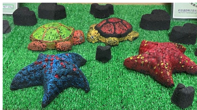
『マイルドパッチ』アートワーク例