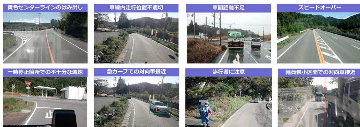
図-1 自動検出する危険事象

前田建設工業は、労働災害防止に寄与するICT技術の導入を促進し、事故のない安全な現場を目指しています。引き続き本システムの検知精度の向上等、システムの改良を進めるとともに、安全な輸送工事のためにさらなる活用を進めてまいります。